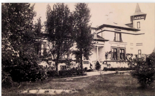
Kerk en klooster Svendborg, Denemarken

In 1899 vertrokken de eerste zusters vanuit Berlaar naar Congo waar de levensomstandigheden bijzonder zwaar waren. Desalniettemin kreeg de missionering binnen de congregatie steeds meer gewicht en steeg het aantal missiezusters. In de loop der jaren werkten 118 zusters in Congo.