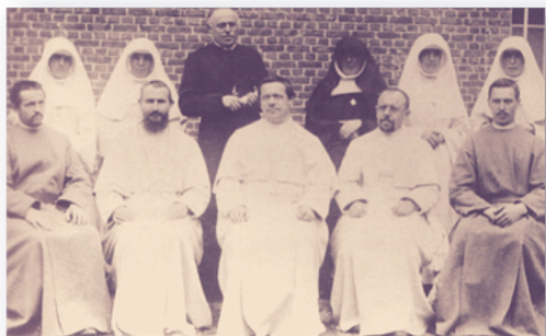
De eerste Congo-karavaan van Berlaar

In de bloeiperiode van de congregatie werden zusters van het Heilig Hart van Maria van Berlaar uitgezonden om in buitenlandse missies onderwijs te starten of te ondersteunen.