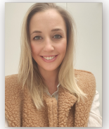
Thanees Nouws Mater Salvatoris Kapellen

"i-MaS is een school met een warm hart. Iedereen neemt de tijd om iemand te helpen, we worden nooit afgewimpeld. Een grote pluim hiervoor!"