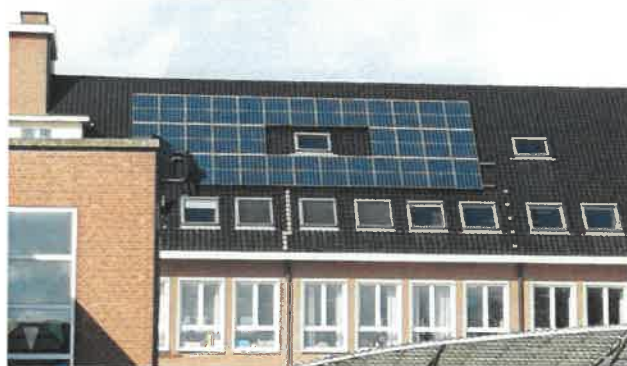
Basisschool Pastorijstraat Berlaar

Na de dakrenovatie van de Kleuterschool De Kleine Sint-Jan (Wiekevorst) zullen ook daar panelen geplaatst worden en als het wachtlijstdossier H. Hart van Maria 2 aan de Misstraat (Berlaar) in uitvoering gaat, komen ook daar panelen. Te Beerzel tenslotte komen er nog een aantal bij, maar dan dient ook in deze school eerst een dakvernieuwing voltooid te zijn.