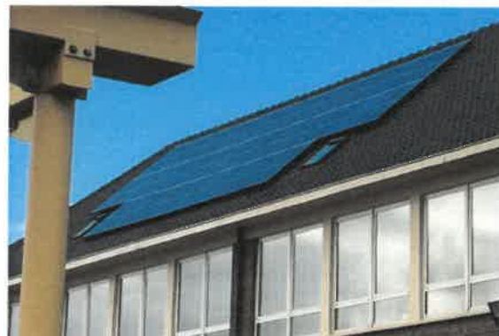
Basisschool Maria Middelaars Beerzel