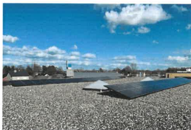
Sint-Jan Lagere School Wiekevorst