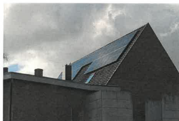
HHvMB, Sollevelden Berlaar